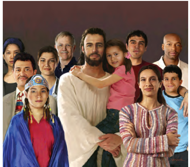
La iglesia de Dios ama a Jesús y guarda Sus Mandamientos.

No espere que la iglesia que ama a Jesús y predica el Evangelio eterno al mundo, y guarda todos Sus mandamientos, sea la más popular en su vecindario. Nuestro problema no es seguir la multitud. Más bien se trata de seguir a Jesús y Su palabra, la Biblia. ¿Escogerá usted ser parte del pueblo remanente de Dios que guarda Sus mandamientos?