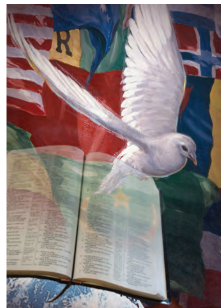
“Este evangelio del reino será predicado en todo el mundo”.