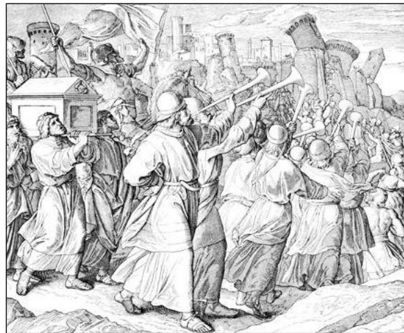
El Sonar de las Trompetas en la Caída de Jericó

[Ver comentarios adicionales en Apoc. 8:2, 10:2 ].