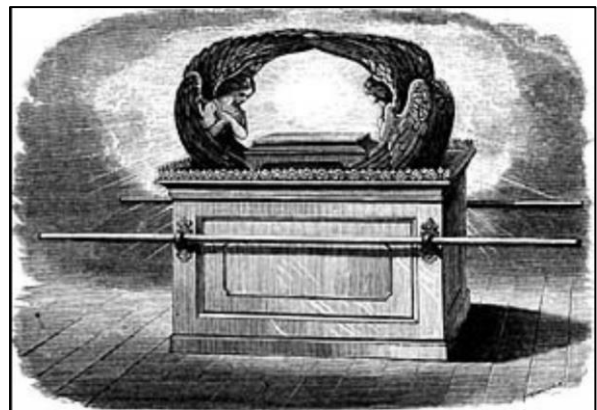
El Arca de Pacto

“Tras el segundo velo estaba la parte llamada Lugar Santísimo . Éste tenía el incensario de oro y el Arca del Pacto cubierta de oro. Esta Arca contenía una urna de oro con el maná, la vara de Aarón que reverdeció y las tablas del pacto . Sobre ella los querubines de gloria cubrían el Propiciatorio. De estos objetos no hablaremos ahora en detalle. ” Heb. 9:3-5 .