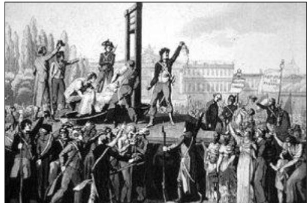
El Reinado del Terror.

“Los historiadores que tratan con este histórico evento usan comúnmente la frase ‘el terremoto de la Revolución Francesa,’ para describir las escenas de esa incomparable convulsión. Burke, en Inglaterra, tres años antes había pronosticado eventos en Francia como conduciendo hacia un ‘ terremoto en el mundo político. ’ Y al llegar, Alison, el historiador, dice: ‘Las mentes de los hombres quedaron sacudidas como cuando el suelo se abre durante la furia de un terremoto. ’ ” Burnside, RWU, 136-137.