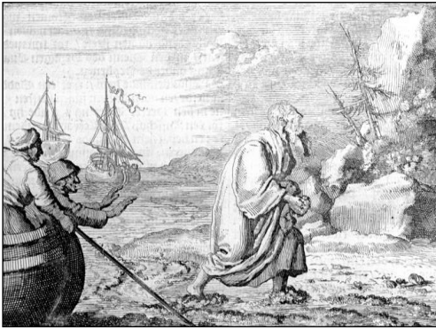
Juan exiliado en la isla de Patmos, el 97 d. C.

las Sagradas Escrituras—la Apocalipsis [ o el Apocalipsis ].” Burnside, RWU, 10.