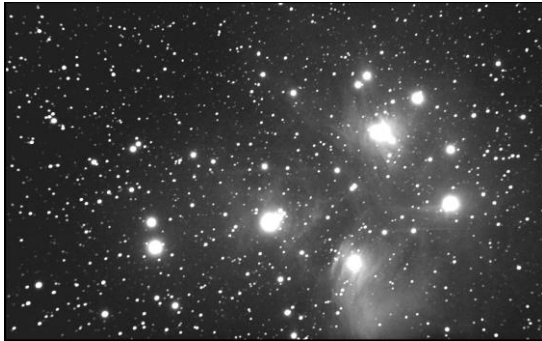
Las Pleyades, un grupo de siete estrellas también conocidas como ‘Las Siete Hermanas’

“¿Eres tú el que mantiene juntas las titilantes Pleyades? ¿Desatarás las ligaduras del Orión? Job 38:31.