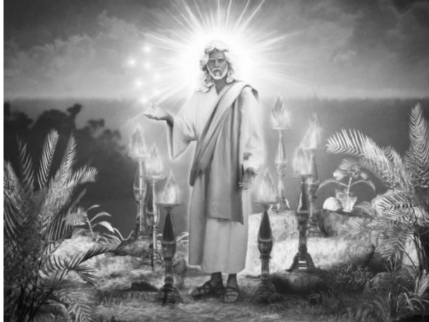
Jesús caminando entre las 7 iglesias en la tierra

“El divino Hijo de Dios es visto caminando en medio de los siete candeleros de oro. Jesús mismo surte el aceite a estas lámparas alumbrantes. Es Él quien enciende la llama. ‘En él estaba la vida; y la vida era la luz de los hombres.’ Ningún candelabro, ninguna iglesia, brilla por sí mismo. De Cristo emana toda su luz. La iglesia actual en el cielo es sólo el complemento de la iglesia en la tierra; pero está más elevada, grande, y perfecta. La misma iluminación divina ha de continuar a través de las edades. El Señor Dios Todopoderoso y el Cordero son la luz de ella. Ninguna iglesia puede tener luz si fracasa en difundir la gloria recibida del trono de Dios. ” Manuscript 1 a , 1890; 6BC, 1118.