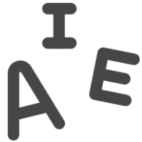
Reconocimiento de letras