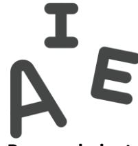
Reconocimiento de letras