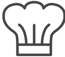
Habilidades para la vida