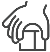
Habilidades motoras gruesas