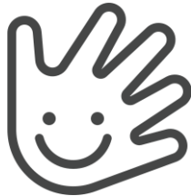
Habilidades motoras finas