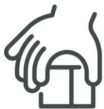
Habilidades motoras gruesas