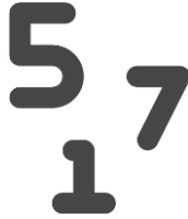
Toma de decisiones