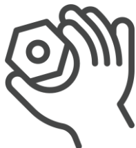
Habilidades motoras finas