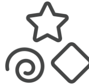
Toma de decisiones