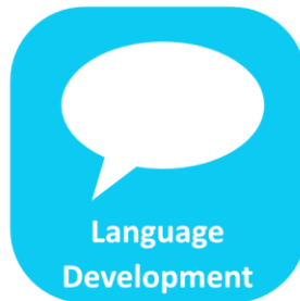
Desarrollo del Lenguaje