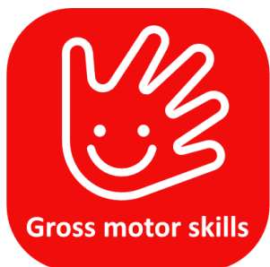
Habilidad motora gruesa