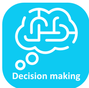
Toma de decisiones