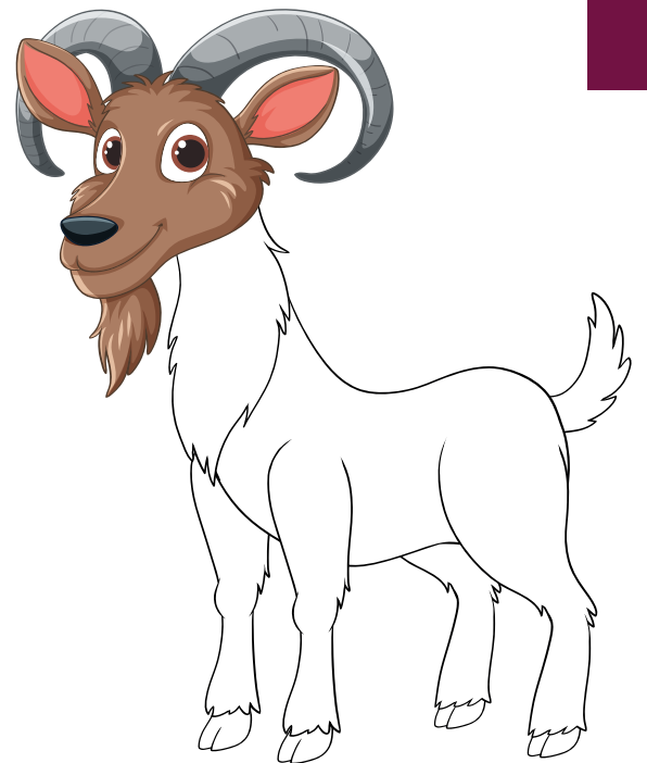
PARA EL SEÑOR