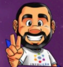
Ilustración de portada: Adinan Batista