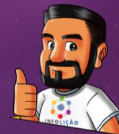
Diseño: Elton Batista