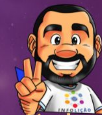
Ilustración de portada: Adinan Batista