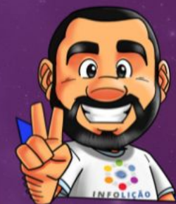
Ilustración de portada: Adinan Batista