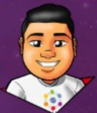
Diseño: Gustavo Santana