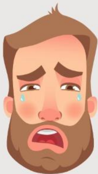
Reconocer el pecado

El arrepentimiento ejerce un rol indispensable en el proceso de justificación, mediante la redención en Cristo Jesús (Rm 3:24). Arrepentirse implica: