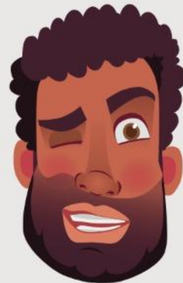
Alejarse del pecado

El arrepentimiento debe ser fundamental en nuestra experiencia cristiana; pues todos somos pecadores. (Rm 3:23)