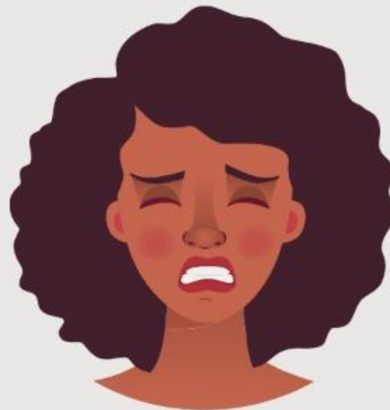
Pedir perdón por el pecado