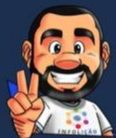
Ilustración de portada: Adinan Batista