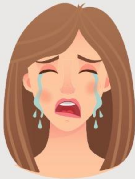
Lamentar el pecado