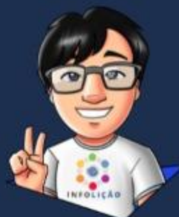
Contenido y diseño: Eduardo Harada