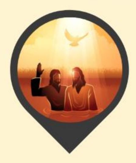
Se sometió a la ley (Fl 2:8)

Jesús vivió una vida sin pecado y nos extendió su gracia en la cruz.