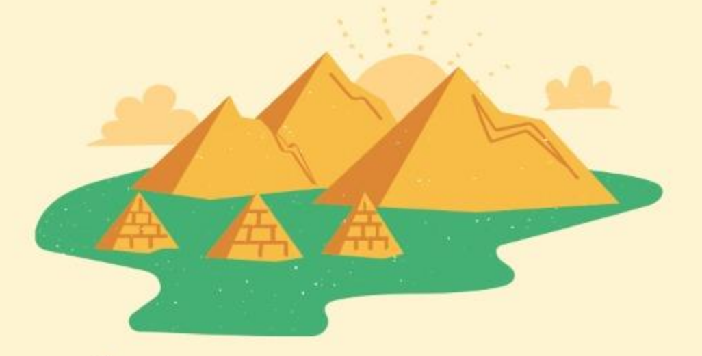
Énfasis en la redención (Dt 5:15)

El sábado era para Israel un recordatorio de la gracia de Dios, tanto de la creación como de su redención desde Egipto.