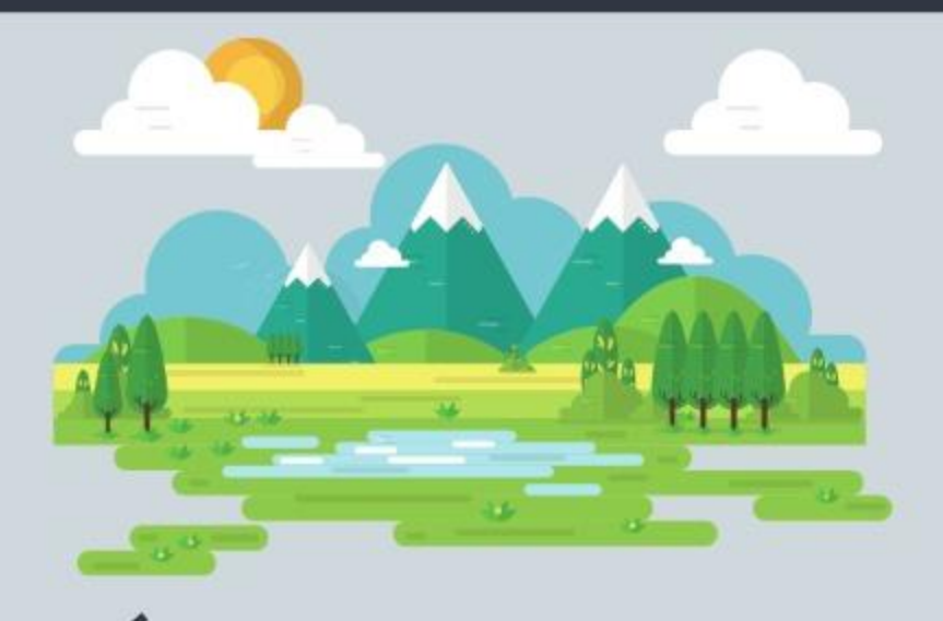
Énfasis en la creación (Éx 20:11)

En Éxodo 20 y Deuteronomio 5, La ley de Dios se presenta desde dos perspectivas; en las cuales se enfatiza por qué el sábado debe ser recordado y guardado.