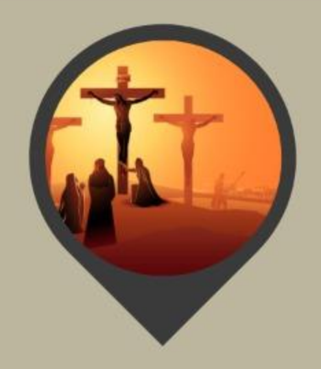
Se anonadó para salvar al hombre (Jn 1:14)