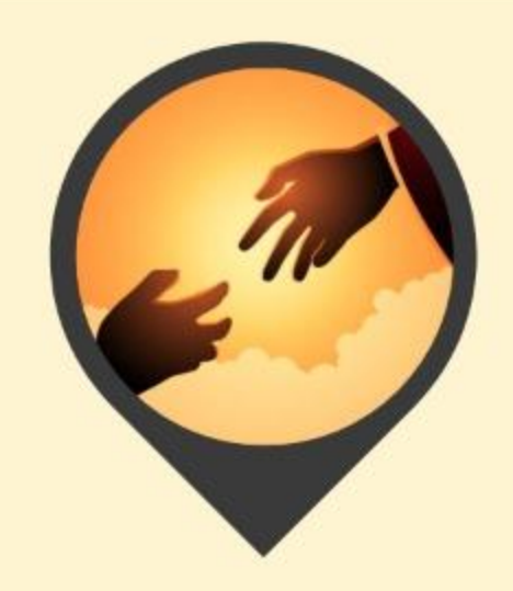
Transciende su creación (Jn 1:3)