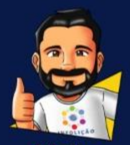
Diseño: Elias Duarte