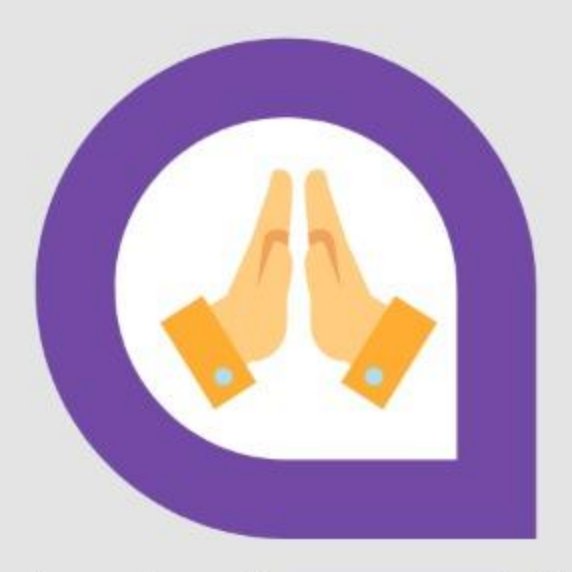
Abraham tuvo fe y se convirtió en el padre de los gentile que se conviritiron (Gl 3:6-9)