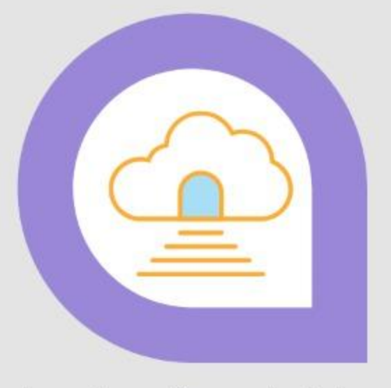
Abraham tuvo fe y anhelaba una patria mejor (Hb 11:8-17; 12:1, 2)

Según Pablo, Abraham no es el padre de la fe porque fue obediente. Él es el padre de la fe porque creyó que Dios cumpliría las promesas del pacto en Cristo (Rm 4:13-25).