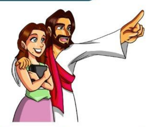
Tema a Dios y guarde sus mandamientos (Ec 12:13, 14)

Se arrepienta, se bautice y reciba al Espíritu Santo (Hh 2:38; Jn 3:5)