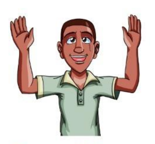
Confiese públicamente su fe en Jesucristo (Mt 10:32)

Se arrepienta, se bautice y reciba al Espíritu Santo (Hh 2:38; Jn 3:5)