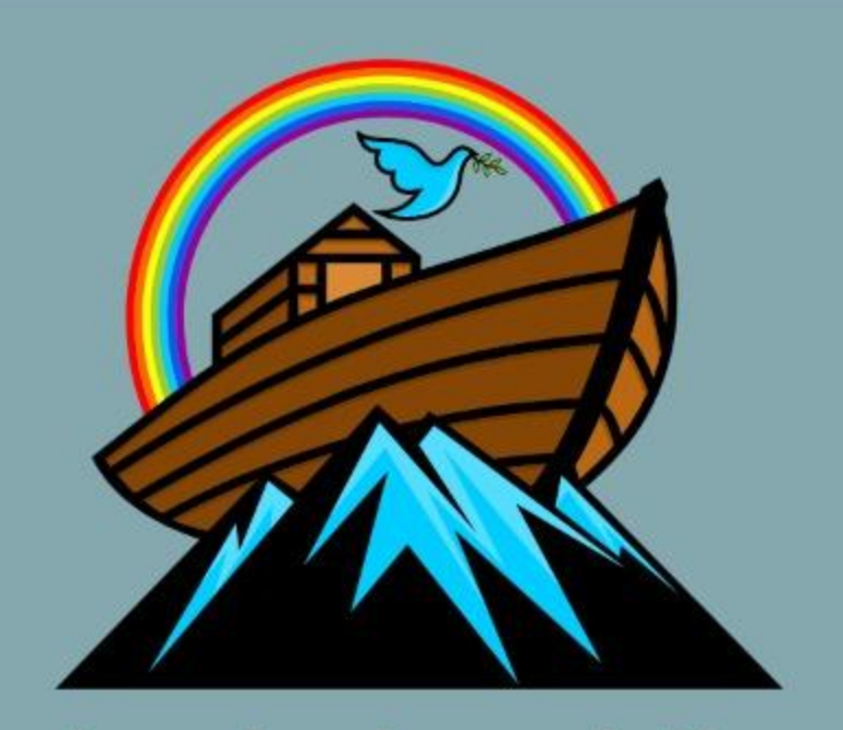
Recordar el pacto de Dios con el mundo. (Gn 9:16)

Si recordamos el significado del arco iris, tenemos la garantía impresa en el cielo a todo color; de que la Palabra de Dios es verdadera. (Gn 9:8-17)