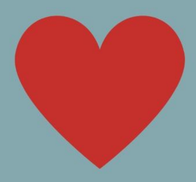
Recordar el amor de Dios por el mundo. (Gn 9:11)