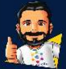
Diseño: Elias Duarte