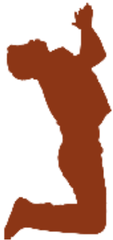
Una lucha intensa

En el pasaje de Efesios 6:10-20, Pablo se despide de los suyos, y piensa en la gran lucha que les espera.