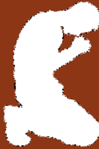
Una lucha constante