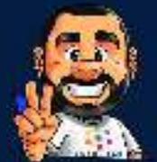
Ilustración de portada: Adinan Batista