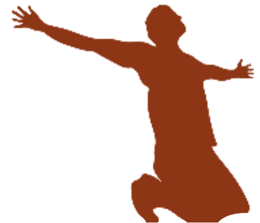
Una lucha espiritual

Para Pablo, el universo entero es un campo de batalla. El cristiano no solo tiene que defenderse de ataques humanos, sino también contra asaltos de fuerzas espirituales que combaten contra Dios.