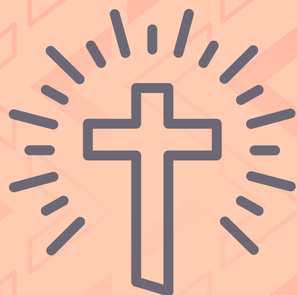
Amor abnegado (Efesios 5:25)