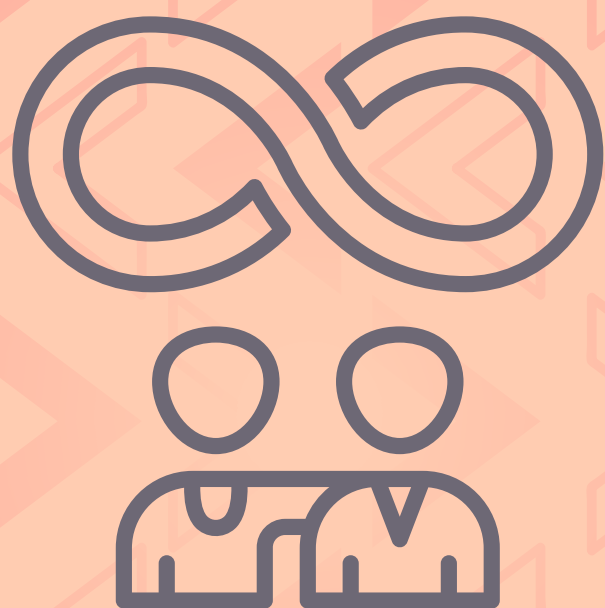
Amor constante (Juan 13:1)

El esposo tiene que amar a su esposa como Cristo amó a su iglesia. ¿Qué clase de amor es?