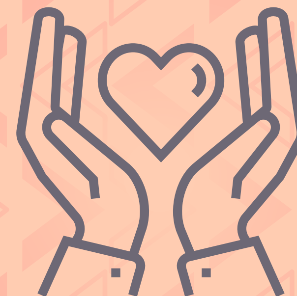
Amor vivificante (Efesios 5:28-30)

« Es deber de la esposa respetar a su esposo, y es deber de este ganarse el respeto de aquella. » (Curtis Vaughan)