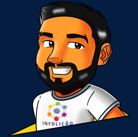
Contenido y Diseño Esron Wasley