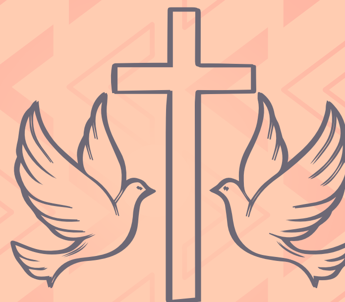
Amor santificador (Efesios 5:26, 27)