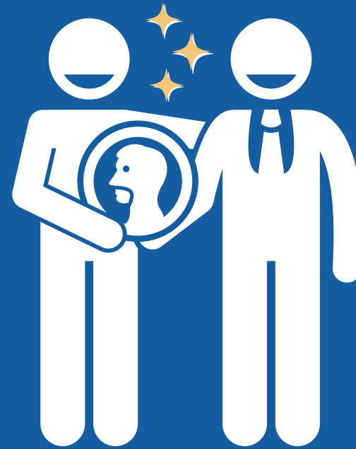
HONRAR A LÍDERES FARSANTES