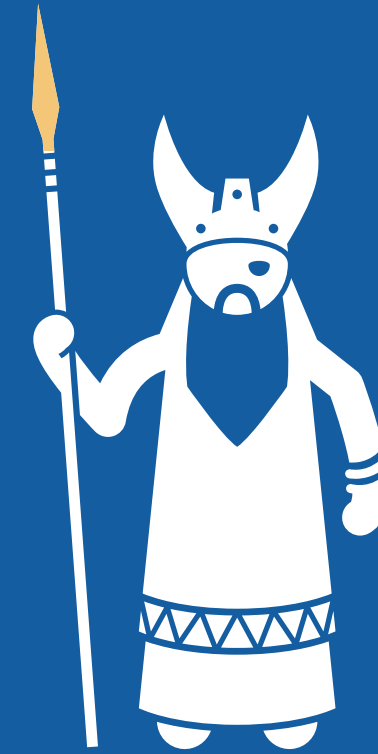
HONRAR A PODERES MALIGNOS

La respuesta de Pablo, es la carta que señala a Cristo exaltado sobre todos los otros poderes, y enfatiza la superioridad del poder que Dios ofrece. (Ef 1:20-23; 2:15-19; 3:14-21; 6:10-20)