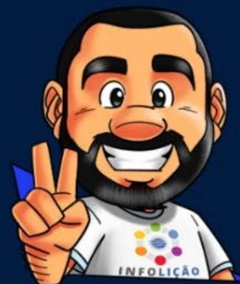
Ilustración de portada: Adinan Batista