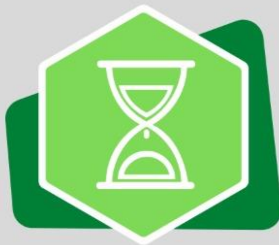
Resistencia (Is 40:31c)