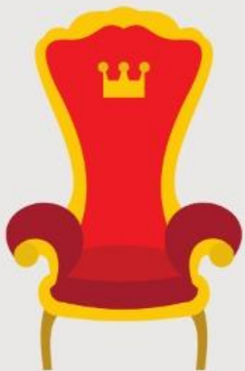
Rasgo de Dios (Rm 9:22)

La paciencia (Gálatas 5:22); es el fruto que nos hace soportar las pruebas con nobleza y sin ira. La Biblia la presenta como un: