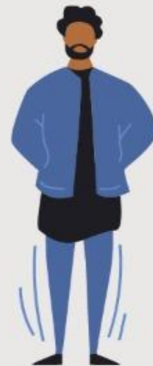
Rasgo del cristiano (Ef 4:1-2)

La paciencia de un cristiano, es fruto de su confianza en Dios y también en sus promesas. (Hebreos 6:9-12)