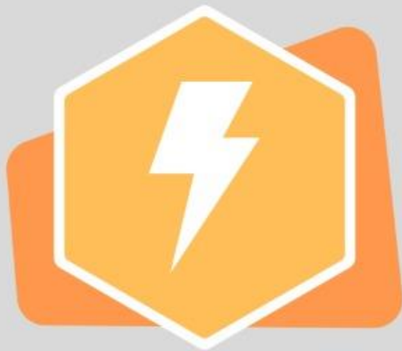
Resiliencia (Is 40:31a)

Hay muchos beneficios para quien espera en el Señor; algunos de los cuales son: