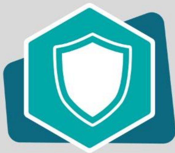
Valentía (Is 40:31b)