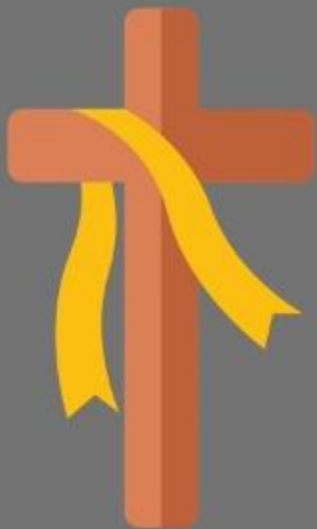
Rasgo de Jesucristo (Lc 23:34)