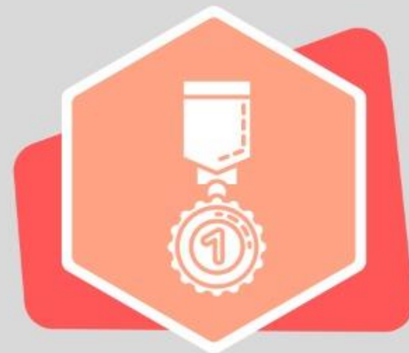
Perseverancia (Is 40:31d)

Los que deciden esperar en Dios; abren los portales de lo extraordinario.