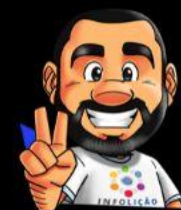
Ilustración de portada: Adinan Batista