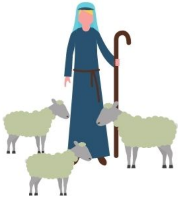
El pastor que cuida (Sl 23:1-4)

El salmo 23 tiene dos figuras: el pastor y el anfitrión actuando en tres escenas: