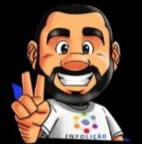
Ilustración de portada: Adinan Batista