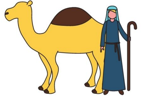
El pastor y el anfitrión que conduce al hogar (Sl 23:6)

Bondad y misericordia parecen ser dos adjetivos para las figuras arribas mencionadas.