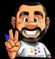
Ilustración de portada: Adinan Batista