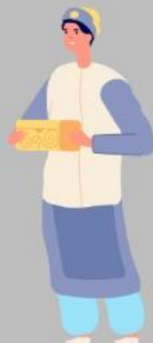
Obediencia Oseas (Os 2)