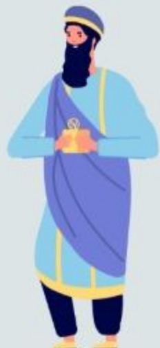
Confianza Abraham (Gn 22)