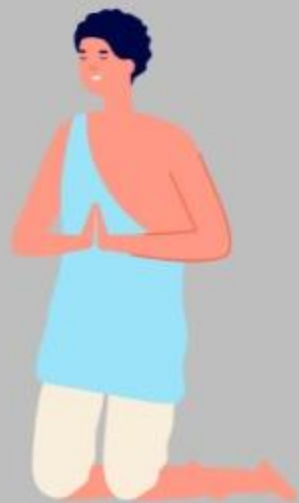
Adoración Job (Jb 1)

Los personajes bíblicos que superaron situaciones extremas; nos legaron su ejemplo de: