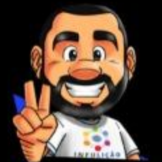
Ilustración de portada: Adinan Batista