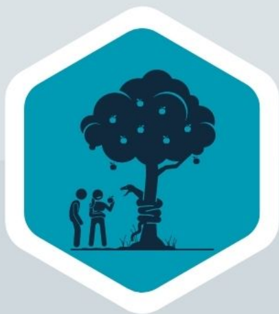
Adán (Gn 1:28)

Fructificar, multiplicar y llenar la tierra, eran elementos del pacto entre Dios y el hombre. Esto se puede comprobar en los pactos con: