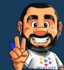
Ilustración de portada: Adinan Batista