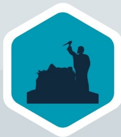
Abraham (Gn 17:6, 20)