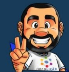
Ilustración de portada: Adinan Batista