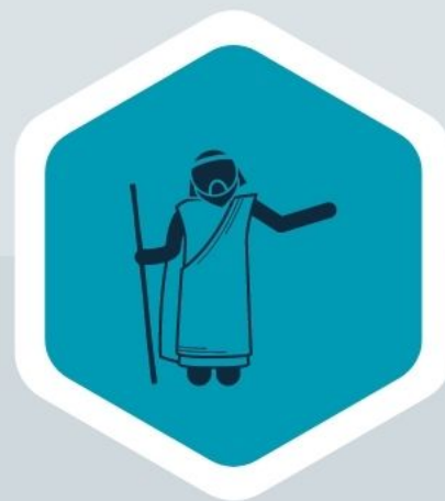
Isaac (Gn 26:4)