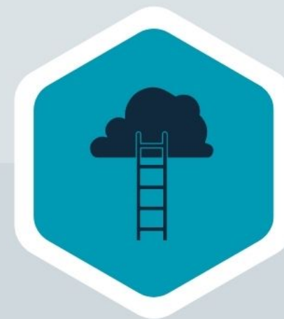
Jacob (Gn 28:14)

Estos elementos van acompañados de la posesión y dominio total de la tierra (Gn 1:28).