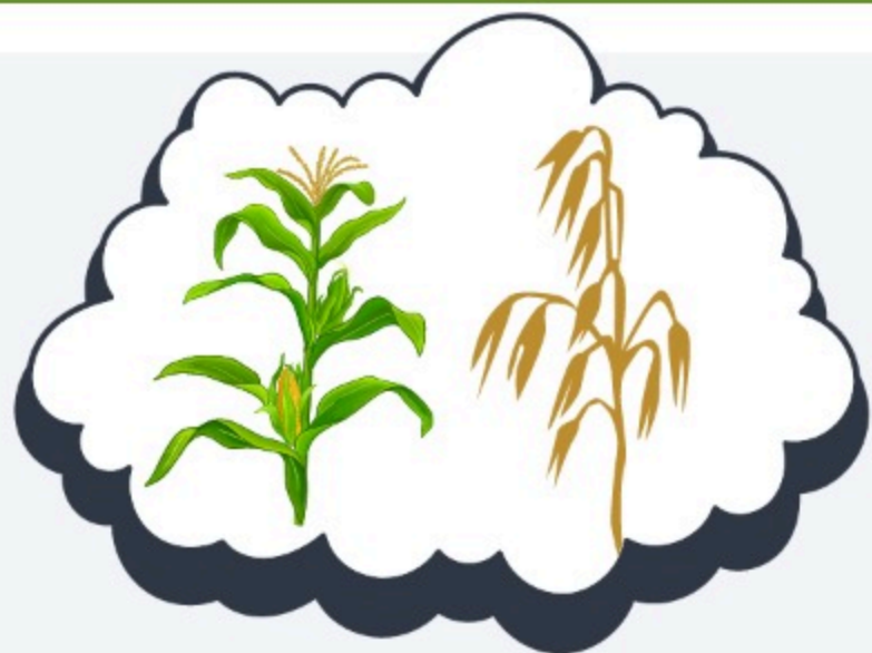
ORIGEN DIVINO (Gn 41:32a)

En los sueños de Faraón, las dos series de símbolos traen consigo dos mensajes importante: