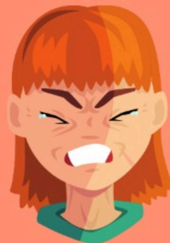
Odio (Gn 37:4)