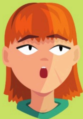
Chisme (Gn 37:2)

Los problemas familiares en la casa de Jacob contribuyeron como base para el ataque a José.