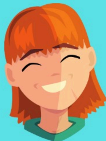
Favoritismo (Gn 37:3)