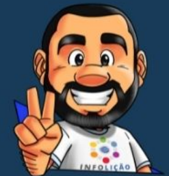
Ilustración de portada: Adinan Batista