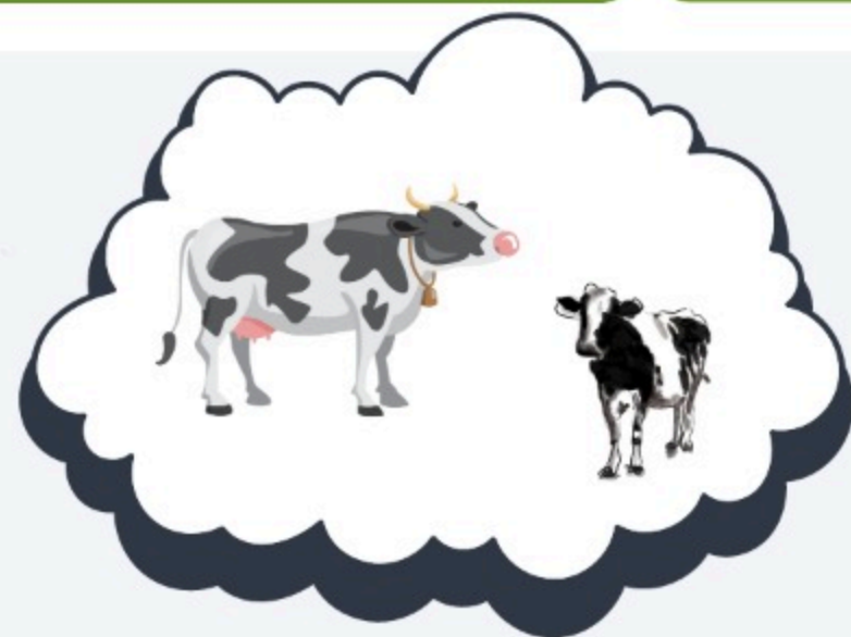
ACONTECIMIENTO INMINENTE (Gn 41:32b)

Dios se reveló a sí mismo a líderes paganos como Faraón y Nabucodonosor para impresionarlos con su omnisciencia, soberanía y cuidado de los que le temen, para atraerlos a Él.