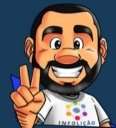
Ilustración de portada: Adinan Batista