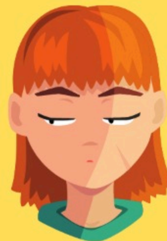
Celos (Gn 37:11)

Aunque los sueños de José procedían de Dios, sus acciones y las de su padre podrían haber sido mas prudentes, para no suscitar tales sentimientos en el círculo familiar.