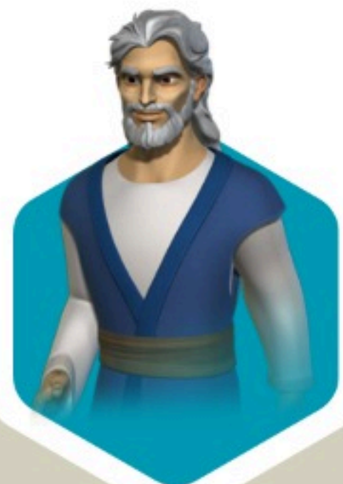
Abraham en Canaán (Gn 14)

En Génesis 14, Dios usó a Abraham para salvar a Lot de la confederación del mal. A lo largo de la historia, él ha usado personas para salvar a su pueblo.