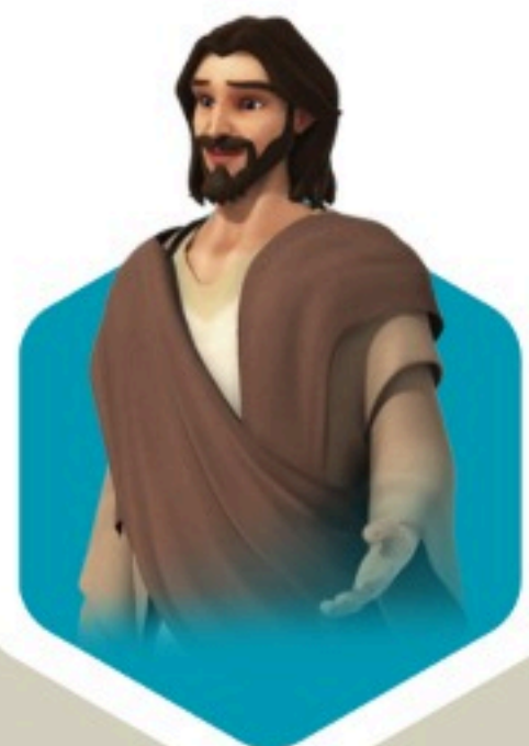
José en Egipto (Gn 41)