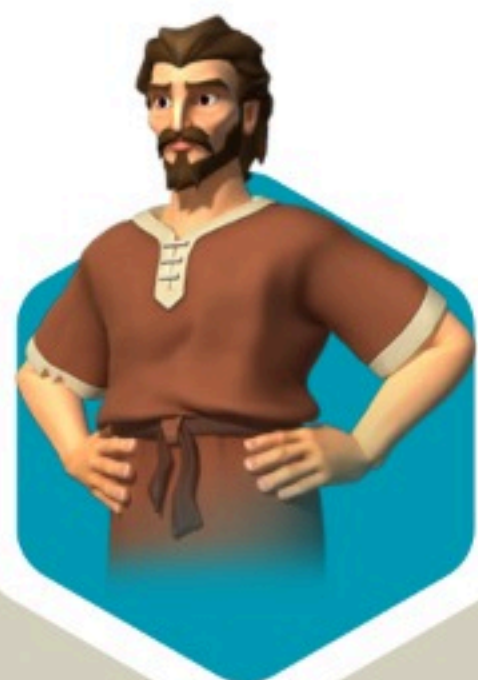
Nehemías en Persia (Ne 2)