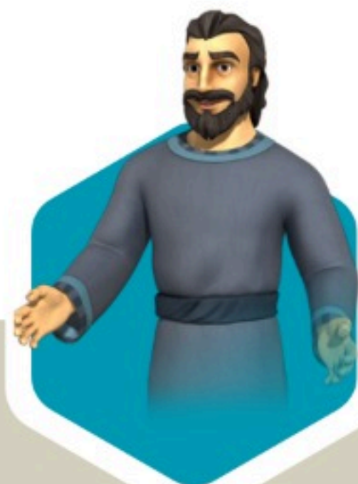
Daniel en Babilonia (Dn 2 y 9)

Podemos cooperar con diferentes personas en innumerables ocasiones para lograr diversos objetivos, pero siempre debemos ser conscientes de nuestra obligación de glorificar a Dios.