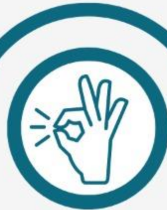
Puro (Hr 7:26c)