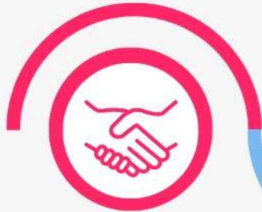
Santo (Hr 7:26a)

Hebreos 7:26 presenta cinco características de Jesús como Sumo Sacerdote.