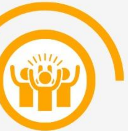
Exaltado (Hr 7:26e)

Por ser santo, sin culpa, sin mancha y apartado de los pecadores; Él es nuestro Salvador y así podemos reflejar su carácter.