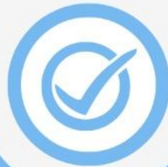
Irreprensible (Hr 7:26b)