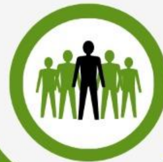
Apartado (Hr 7:26d)