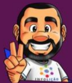
Ilustración da portada: Adinan Batista