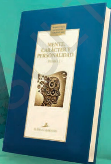
Mente, carácter y personalidad TD - Tomo 2 8134