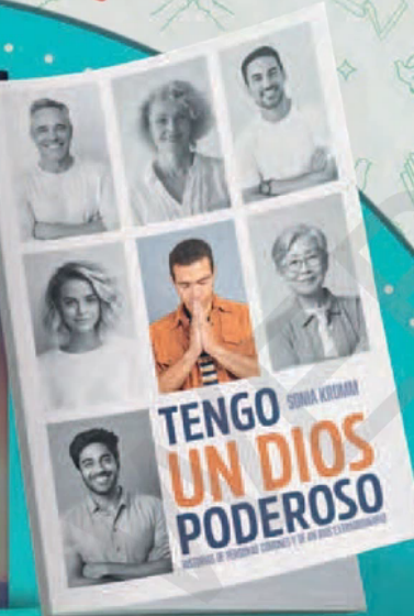
Tengo un Dios poderoso 13538