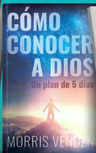
Cómo conocer a Dios 12596