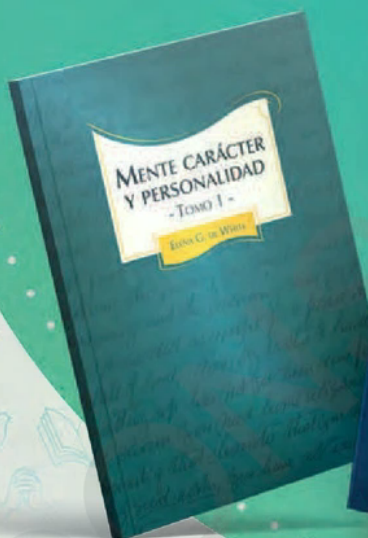
Mente, carácter y personalidad TF - Tomo 1 10134