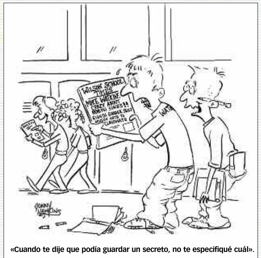
«Cuando te dije que podía guardar un secreto, no te especificué cuál».