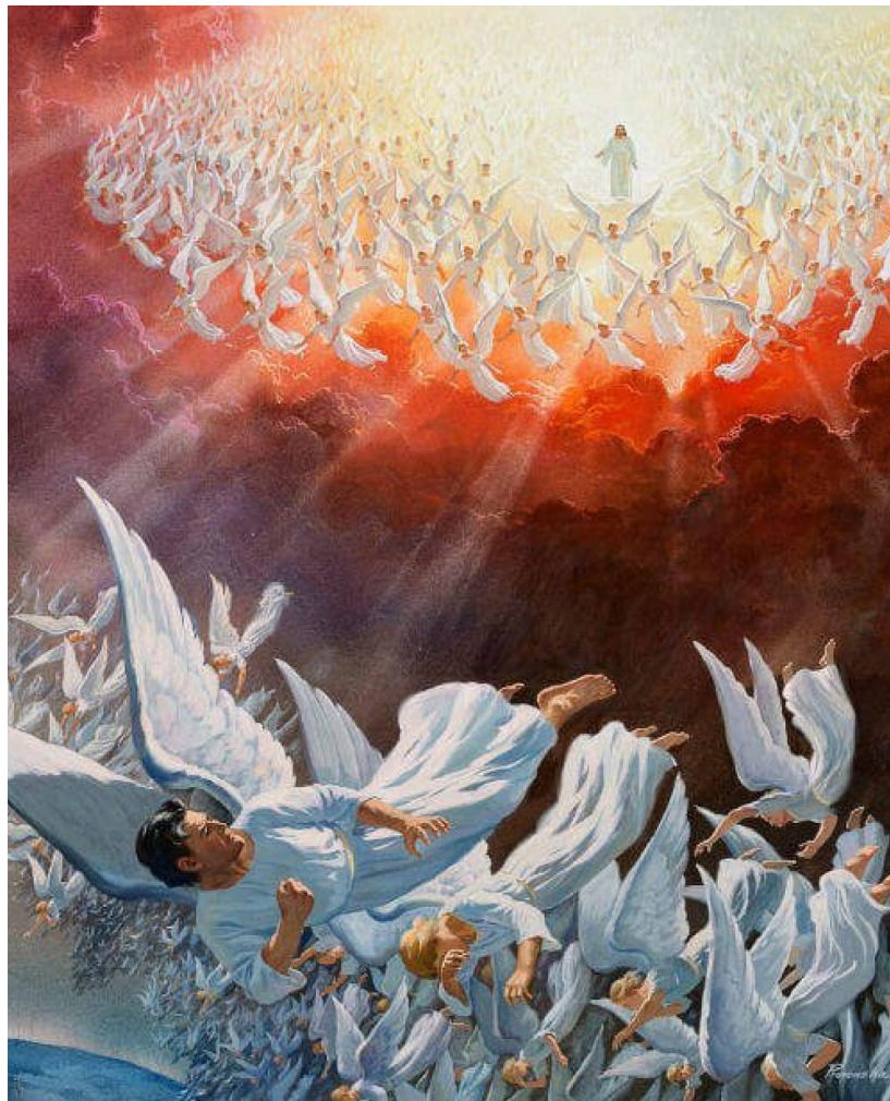
Satanás y sus ángeles echados del cielo.

Pero el mismo Dios eterno da a conocer así su carácter: “¡Jehová, Jehová, Dios compasivo y clemente, lento en iras y grande en misericordia y en fidelidad; que usa de misericordia hasta la milésima generación; que perdona la iniquidad, la transgresión y el pecado, pero que de